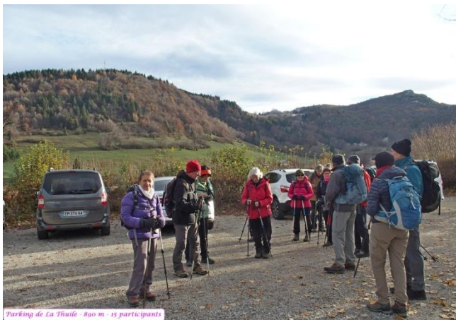
Parking de La Thuile - 890 m - 15 participants

Le moral lui est serein. Peu de dénivelé, faible kilométrage. Passages éventuellement aériens mais évitables par contournement. Tout va bien. Le Roc de Torméry culmine à 1135 m. Un empilement de feuilles mortes à la pointe du bâton nous cheminons gaiement. Nous perdons brièvement la trace à l'occasion d'un croisement de sentiers un peu brouillon mais rien d'anxiogène.