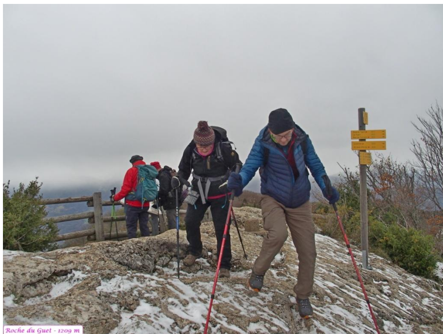
Roche du Guet - 1209 m

Nous progressons sur une crête en dévers caillouteuse et bien glissante.